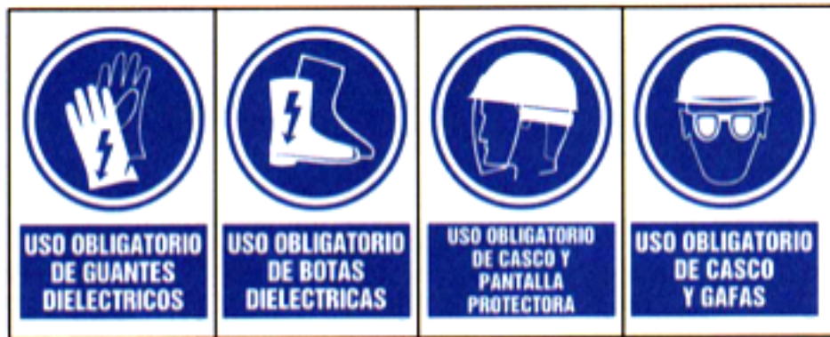
Ejemplos de señales de obligación para trabajos eléctricos.

Además, tal y como se especifica en la Ley de Prevención de Riesgos Laborales, el empresario deberá entregar gratuitamente los EPI's para la realización de los trabajos en los puestos que así lo requieran , velando siempre por la utilización de estos equipos de protección por parte de los trabajadores.